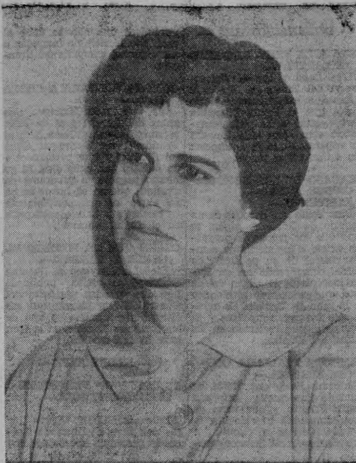
Doña VIOLETA BARRIOS DE CHAMORRO

La estimable y culta dama doña Violeta Barrios de Chamorro, que durante largo tiempo vivió en Costa Rica, captándose numerosas simpatías en el ambiente social, sale de regreso para su patria, Nicaragua, acompañada de sus hijos.