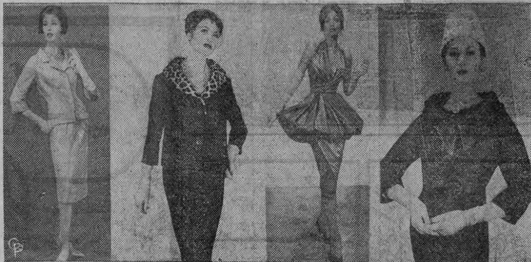
COLECCION DE MODAS: Estas fotos, tomadas con la cooperación del Instituto del Vestido de Nueva York, muestran algunas modas para el otoño, (de izquierda a derecha), traje de lana. (Abajo, de izquierda a derecha), brocado para asistir al teatro.